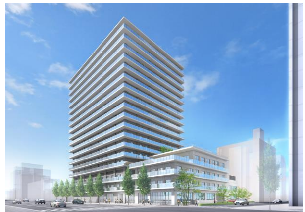
(建物完成イメージ)

高齢者の方にもご安心いただけるよう、介護・医療の連携を強化し、通院が困難な方への在宅診療等を提供します。